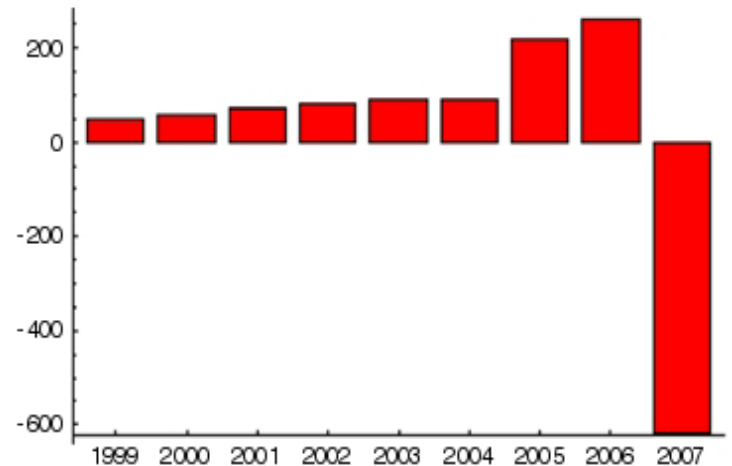
Fig. 1. Indy Mac's annual income (in millions) between 1998 and 2007. We can see fat tails at work. Tragic errors come from underestimating potential losses, with the best known cases being FNMA, Freddie Mac, Bear Stearns, Northern Rock, and Lehman Brothers, in addition to numerous hedge funds.